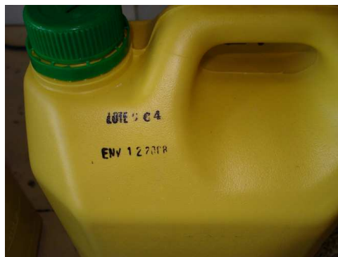
Registro de lote y fecha de envasado

La información presente en la etiqueta no está completamente de acuerdo con la legislación y normativa que se aplica a este tipo de productos.